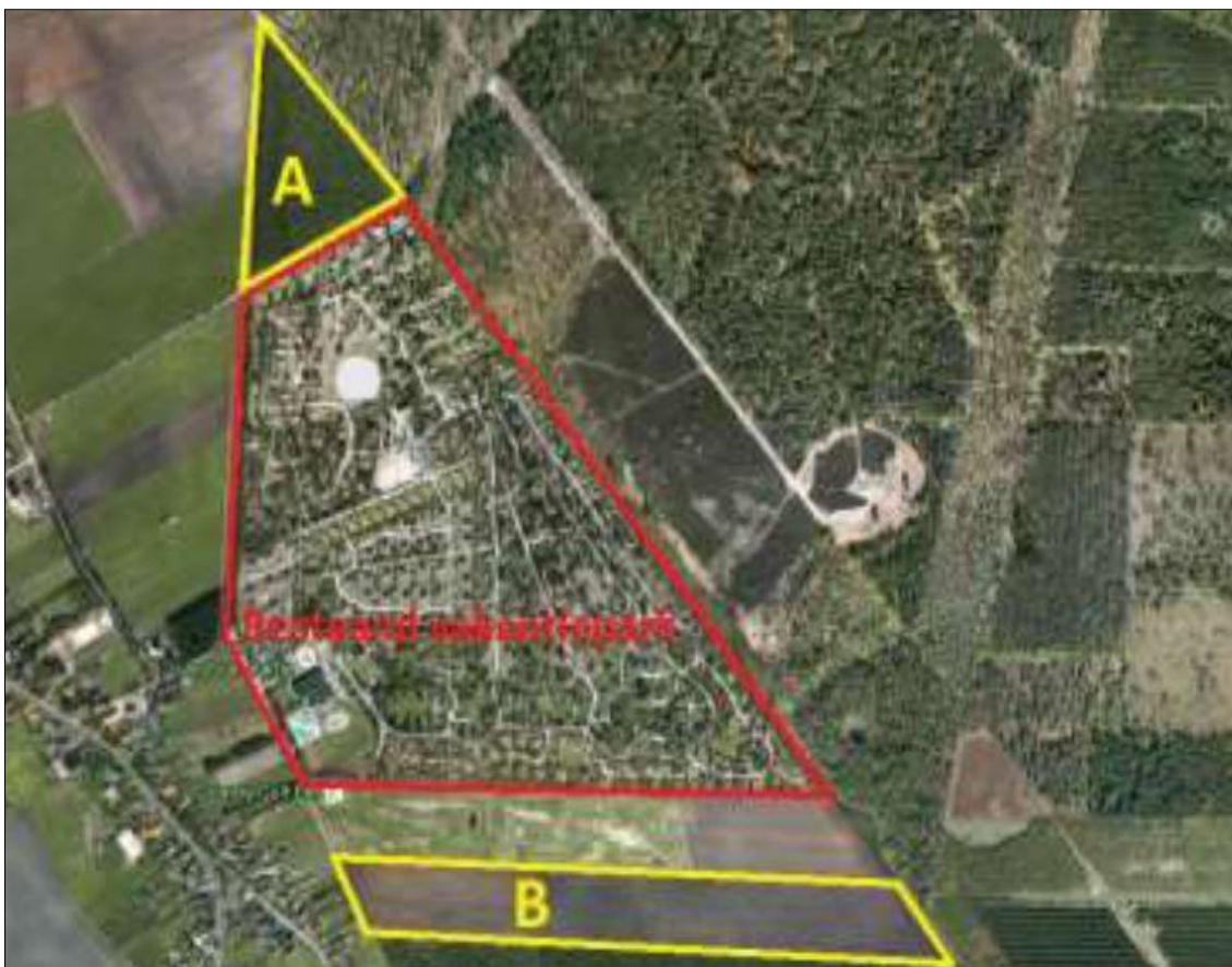
Het bestaande vakantiepark met de uitbreiding (perceel A en B)

Het vakantiepark 'Het Land van Bartje' heeft twee percelen grond aangekocht, één ten noorden (perceel A) en één ten zuiden (perceel B) van het bestaande vakantiepark. De bedoeling is om het bestaande park uitbreiden en anders inrichten, waarmee een kwaliteitsverbetering van het hele park kan worden doorgevoerd.